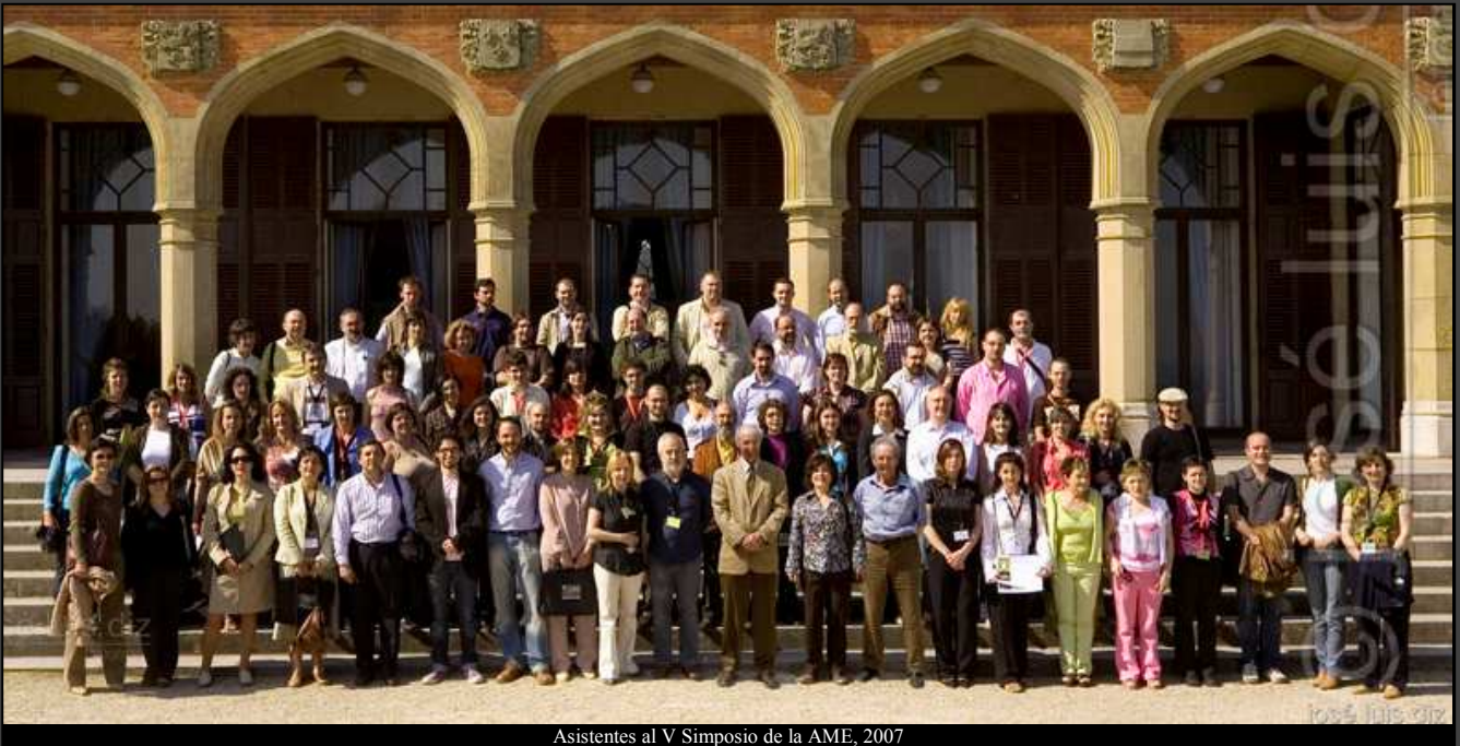
Asistentes al V Simposio de la AME, 2007