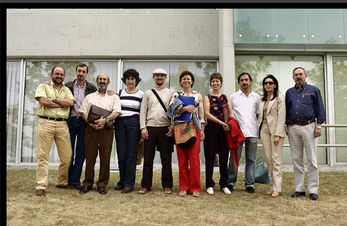
Reunión de la AME. Madrid 26-06-2006